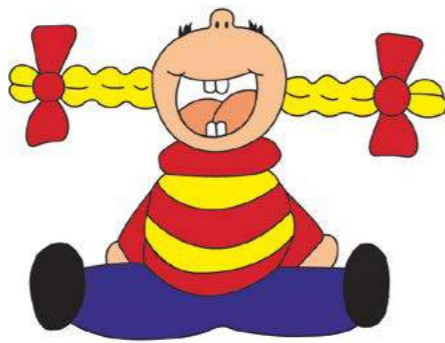
Das Maskottchen der Lahn-Kinderkrippen e. V.

Wichtel, Elfen und Zwerge leben in der ›Kritzelburg‹, der ›Krümelkiste‹, der ›Bärenhöhle‹, im ›Piratennest‹, der ›Villa Kunterbunt‹ und ähnlichen Orten, die womöglich alle im Auenland liegen. Unter dem Motto ›Bobby-Car statt Gabelstapler‹ leistet die ProConsult GmbH ihren Beitrag zur sicheren Unterbringung der kleinen Armee.